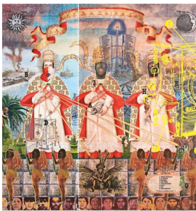
Caja negra, de Ángel Valdez y Alfredo Márquez. Acrílico y serigrafía sobre lienzo.

Están en segundo lugar las obras de los que trabajan con iconografías de la historia del arte o de la botánica; es el caso del argentino León Ferrari, quien en su collage Nunca más hace refe-