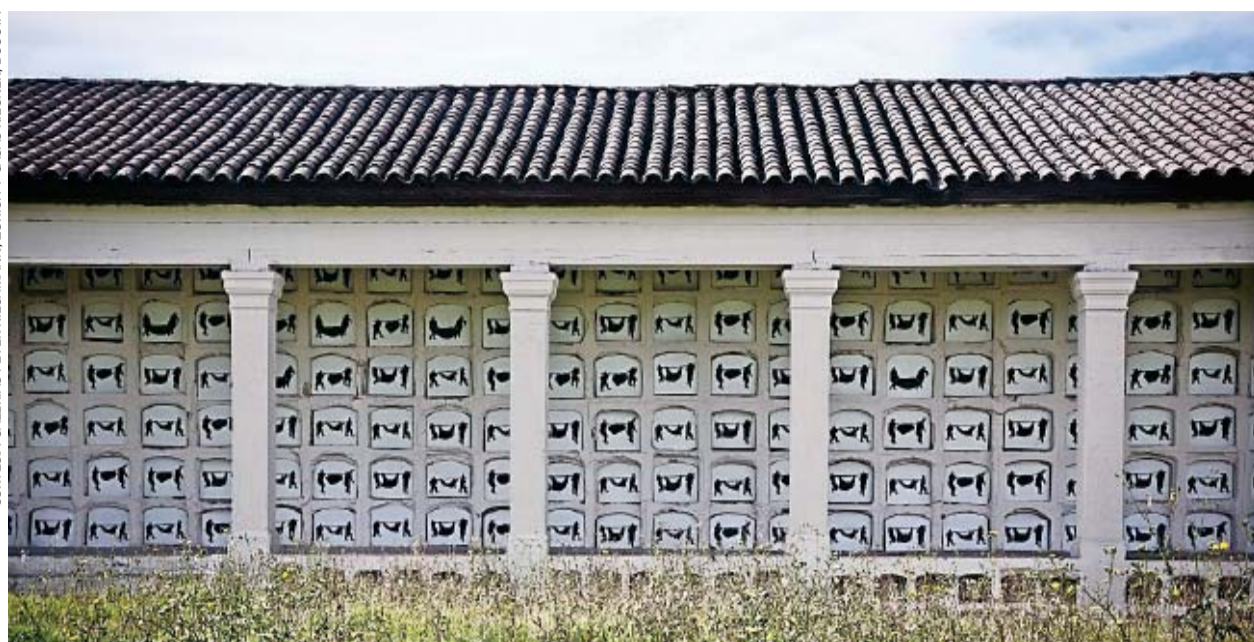
Beatriz González: Auras anónimas (2007-2009), instalación en cuatro columbarios del Cementerio Central.